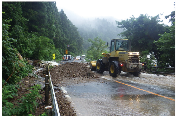
国道47号 H30.8.5 戸沢村高屋地区の被災状況(土砂流出)