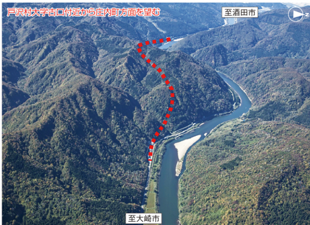
事業区間周辺(航空写真)