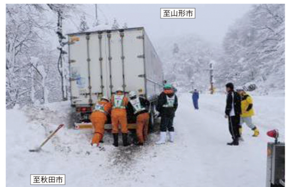
国道13号 大型車の立ち往生による通行止め(秋田県側)(H24.12.11)