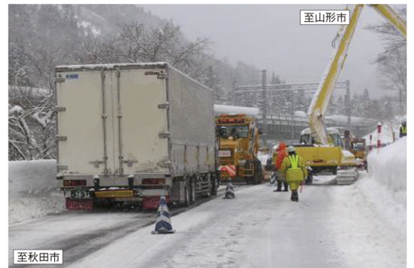
国道13号 通行規制を伴う雪崩・落雪予防*作業(秋田県側)(H22.2.10) ※法面やトンネル出入口に雪が溜まり、道路に落下する危険があるため、定期的に取り除く作業