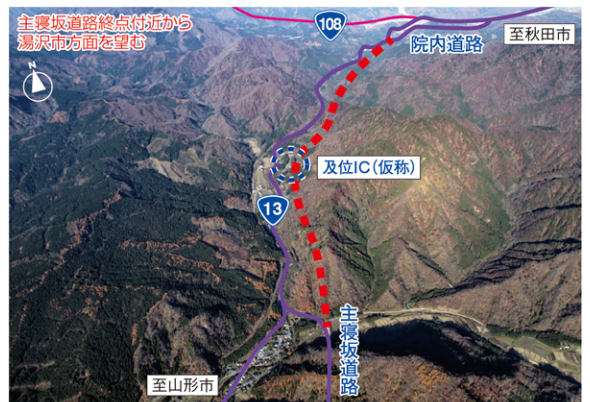
事業区間周辺(航空写真)