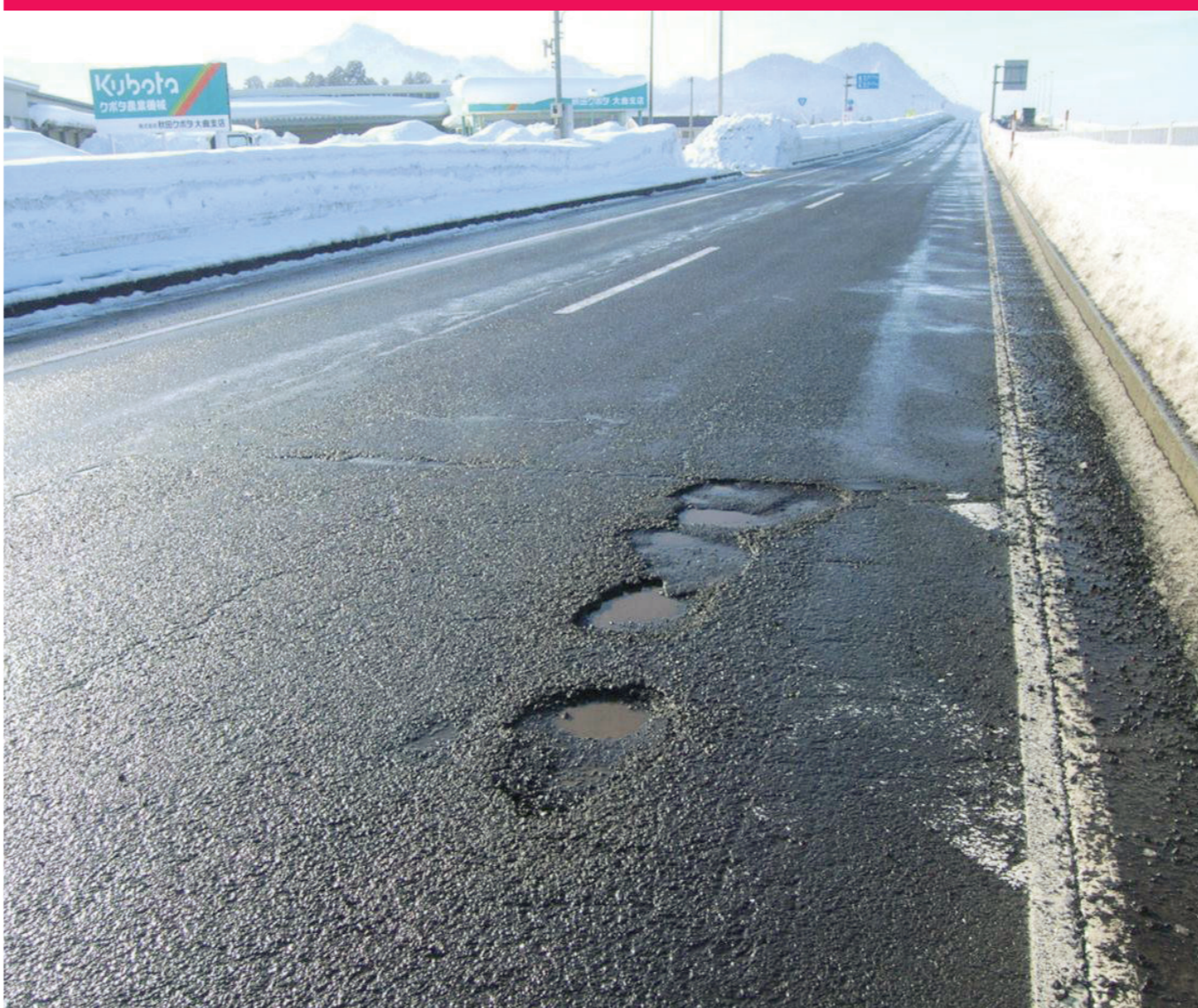
路面の穴ぼこ・段差