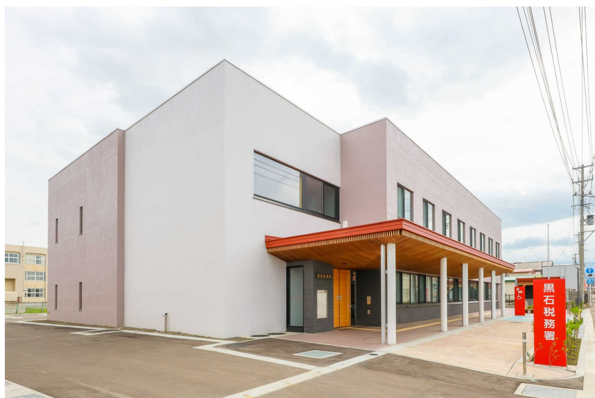
〔黒壁・赤屋根・こみせ〕