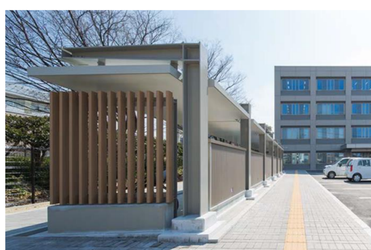
〔融雪対応のアプローチ歩道と木材活用を図った自転車置場〕