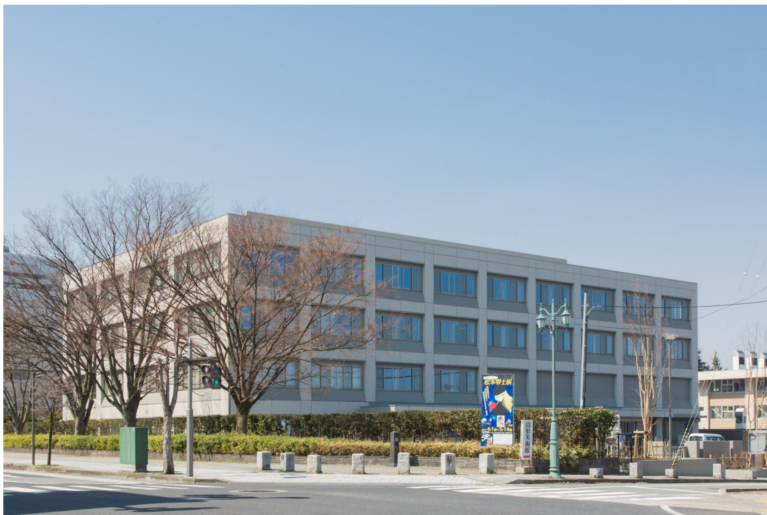
〔東側沿道緑地から庁舎を望む〕

また、ユニバーサルデザインに留意し、高齢者、身障者を問わず、全ての人に利用しやすい庁舎としています。