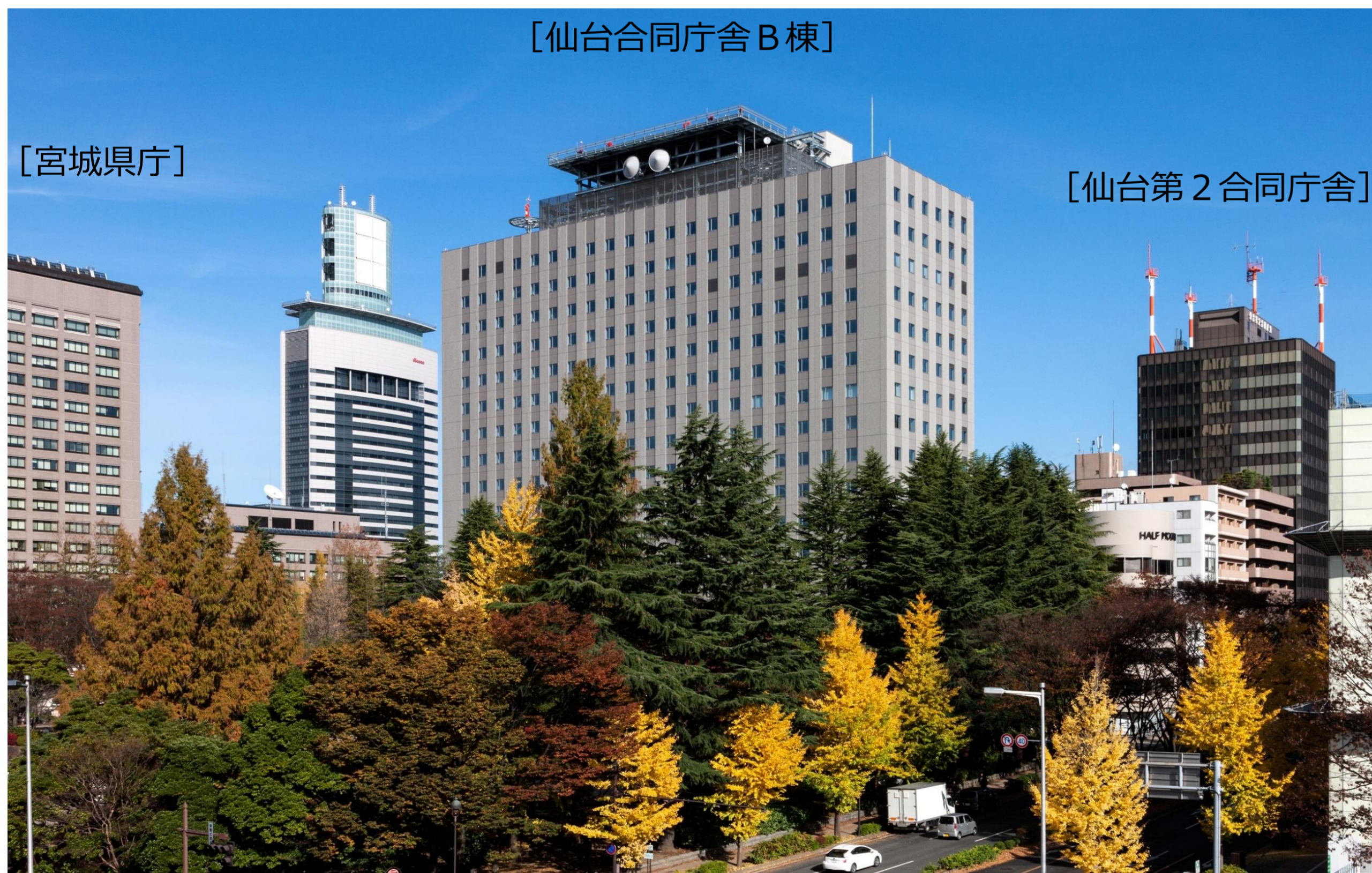
【庁舎遠景（左下は勾当台公園）】

構造：地上 鉄骨造（柱CFT造）、地下 鉄骨鉄筋コンクリート造（一部鉄筋コンクリート造） 地上17階、地下2階、塔屋1階建