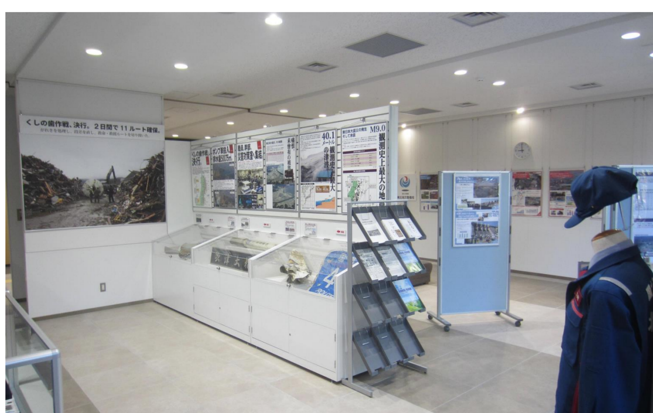
【行政情報プラザの震災関連展示】