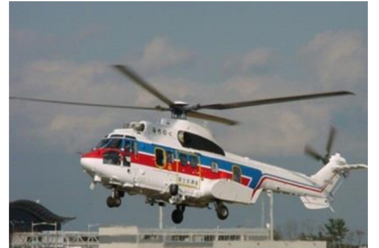
【防災ヘリ みちのく号】