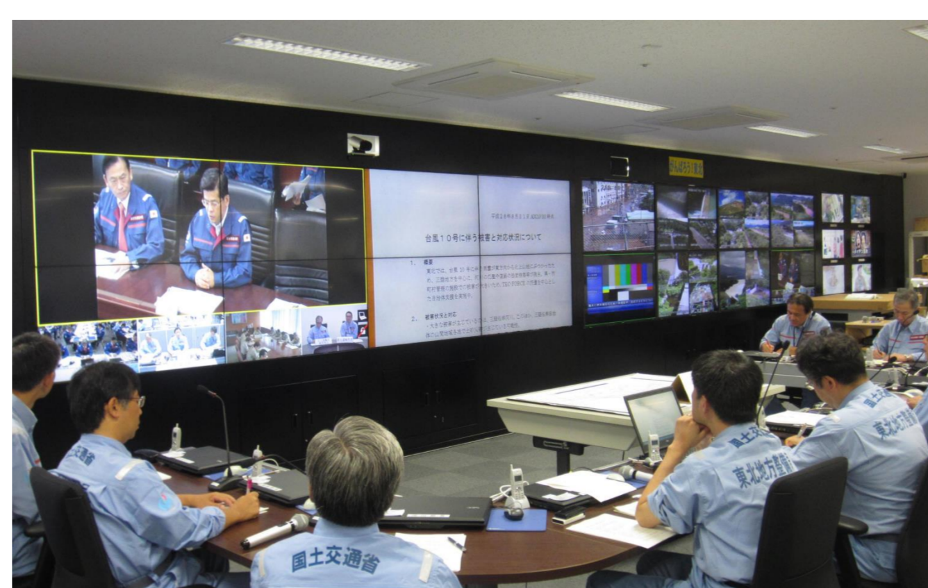
【災害対策室でのテレビ会議】