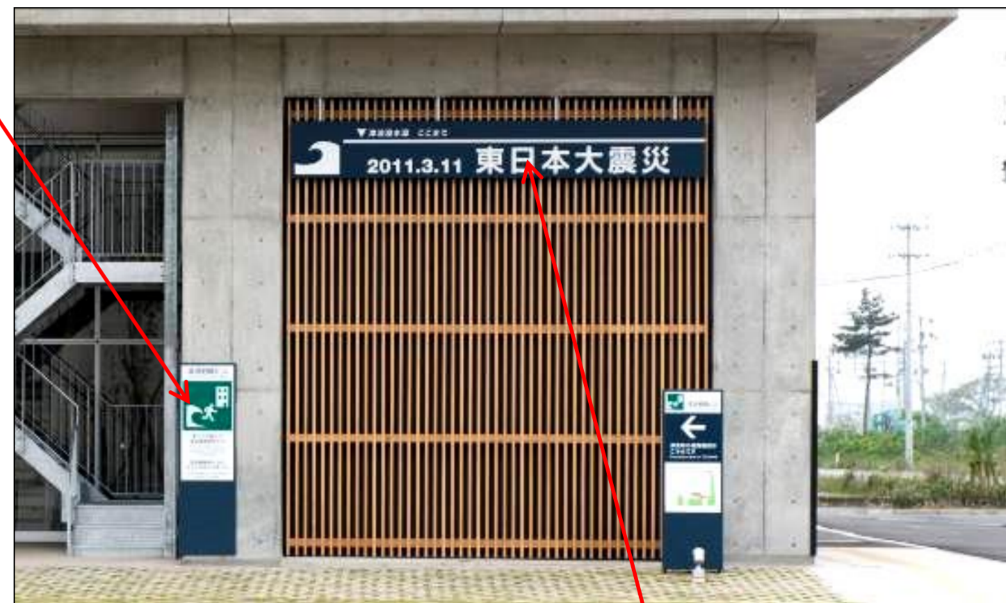
[東日本大震災の津波浸水深]